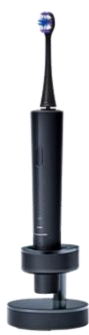
Doltz EW-DT73 (Panasonic)

歯の汚れは見えているところだけではなく「歯周ポケット」という歯茎の中にも溜まっていく。 この歯周ポケット内の汚れは、通常の歯ブラシで除去することは困難である。 Panasonicから発売されている電動歯ブラシ「Doltz」は、音波の振動や水流により歯周ポケット内の汚れまで取り除くことができる。